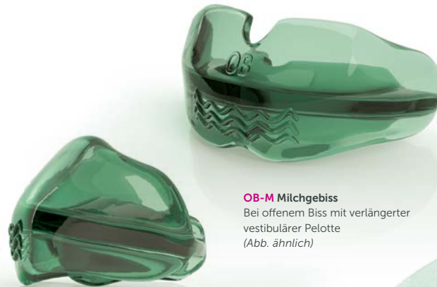
OB-M Milchgebiss Bei offenem Biss mit verlängerter vestibulärer Pelotte (Abb. ähnlich)

Durch Schließen des offenen Bisses wird die fehlerhafte Lautbildung behoben, die Aussprache verbessert und das Abbeißen mit den Schneidezähnen wieder möglich.