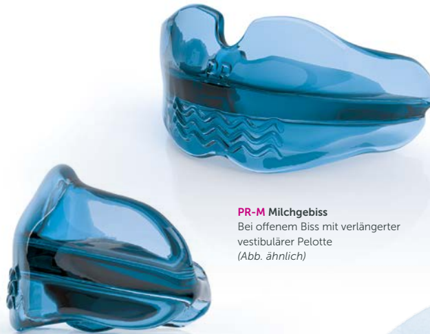
PR-M Milchgebiss Bei offenem Biss mit verlängerter vestibulärer Pelotte (Abb. ähnlich)

Durch die Abschirmung störender Weichteile im Mund (Zunge und Wangenschleimhaut) sowie die Aktivierung der Mund- und Lippenmuskulatur können sich Zähne von selbst in die richtige Position einordnen.