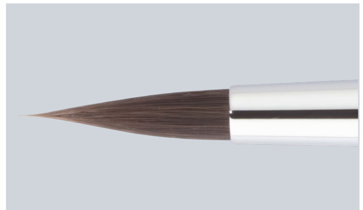
Performance-Pinsel mit Bionic Hair