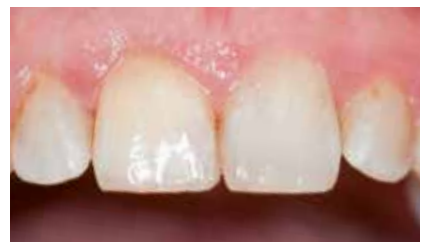
Ästhetisch überzeugendes Ergebnis