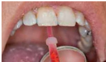
Einbringen des Aufhellungsgels in die Kavität mit beiliegender feiner Kanüle