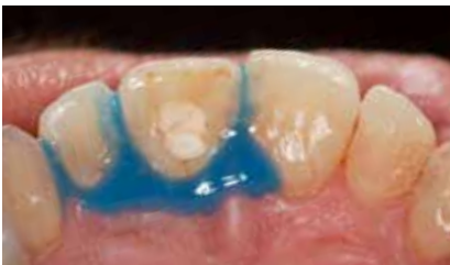
Palatinale Ansicht mit aufgetragenem Gingivaschutz LC Dam