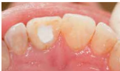
Dichter Verschluss der Kavität mit Glasionomer-Material