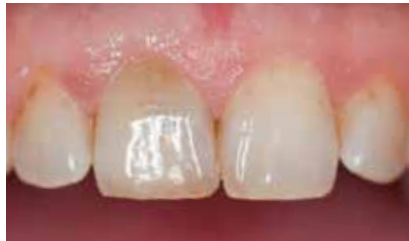
Deutlich sichtbare Verfärbung am Zahn 11