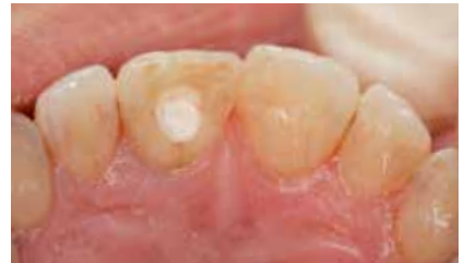
Offenes Pulpacavum mit Verschluss des Kanaleingangs