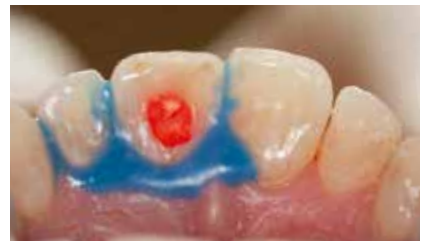
Perfect Bleach Office+ in der Pulpakammer