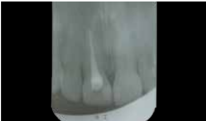
Randständige, klinisch einwandfreie Wurzelfüllung am Zahn 11