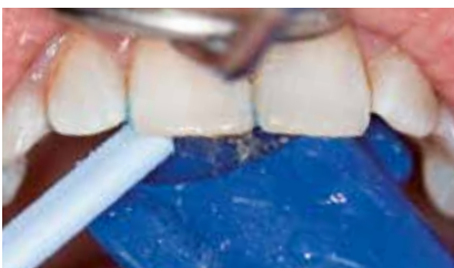
Sorgfältiges Ausspülen und Absaugen des Aufhellungsgels