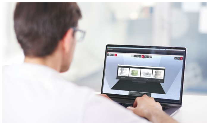
Logiciel slicer SIMPLEX avec paramètres pré-réglés pour l'orthodontie