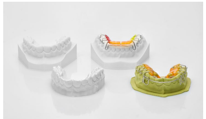
Conçu pour la confection de tous les modèles d'ODF