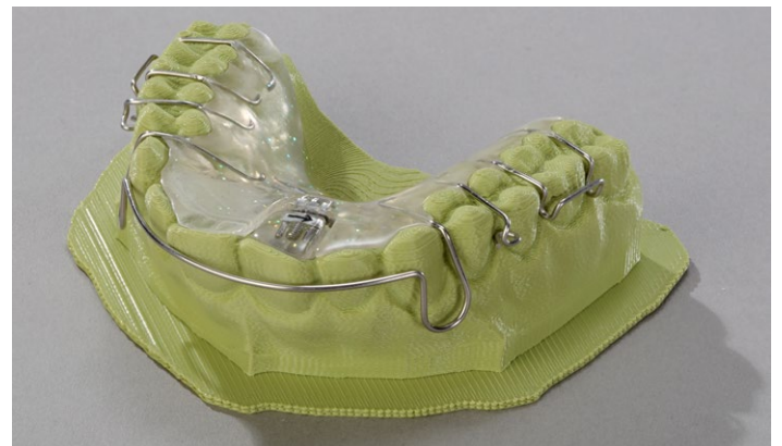
Il est possible de travailler avec le modèle comme d'habitude, sans aucun traitement supplémentaire